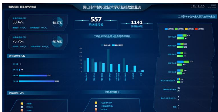
图 2：华材职校超星学习通教学平台基础数据检测

周汇总分析，多项举措的落实，更全面地了解到老师、学生教与学的具体情况，更重要的是确保了“停课不停教、不停学”的行之有效。