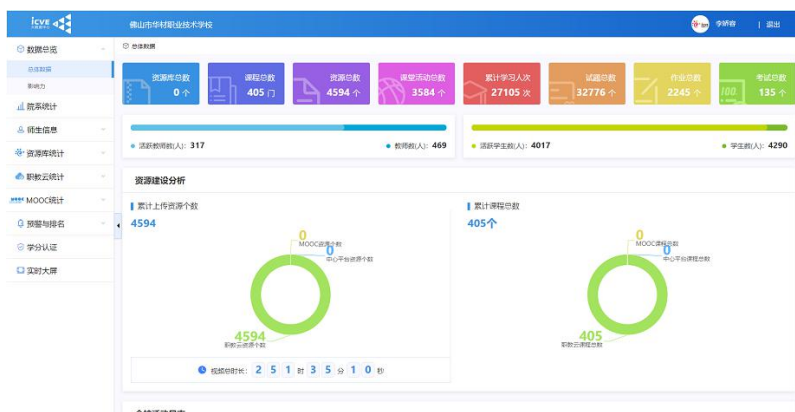
图 1：华材职校“职教云”教学平台数据总览

（2）组织教师建课。组织教师学会平台操作，组织教师建课。任课教师均需根据班级基础和特点进行建课，具体应包括学习资源、学习组织形式、学习评价、在线提问与答疑等。